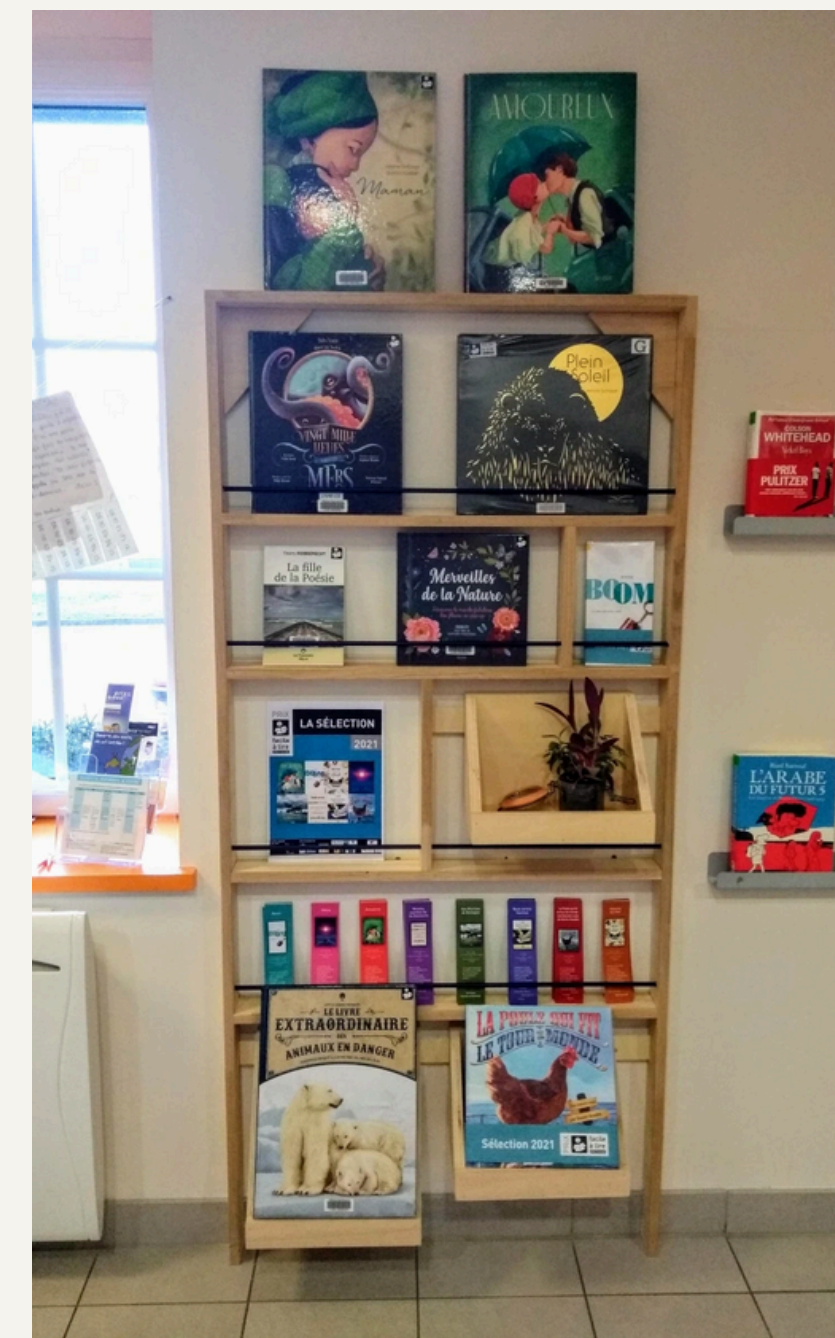
Bibliothèque d'Ille et Vilaine