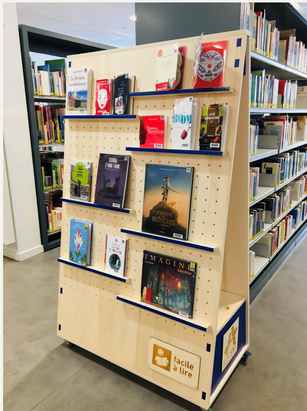
Bibliothèque de l'Aine