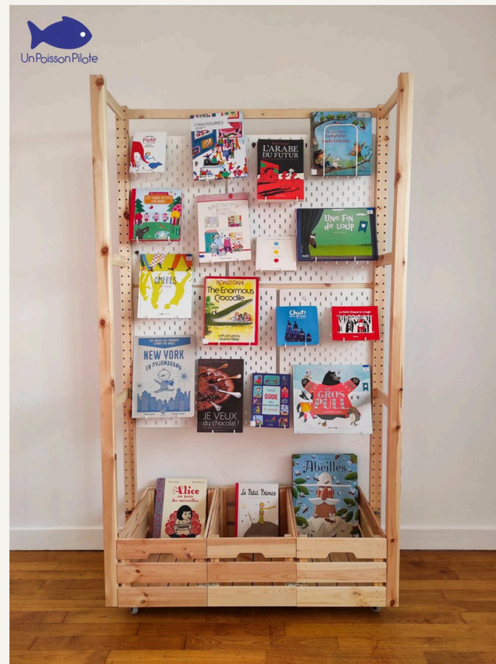
Un Poisson Pilote